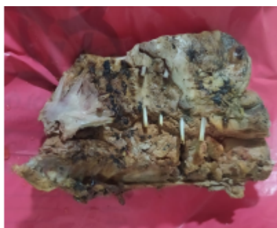
Foto 3. Verificación del producto SA-MA-21-0065 carne de chigüiro (Hydrochoerus hydrochaeris) incautado. Acta Única de Control al tráfico ilegal de flora y fauna silvestre No. AI 161148.